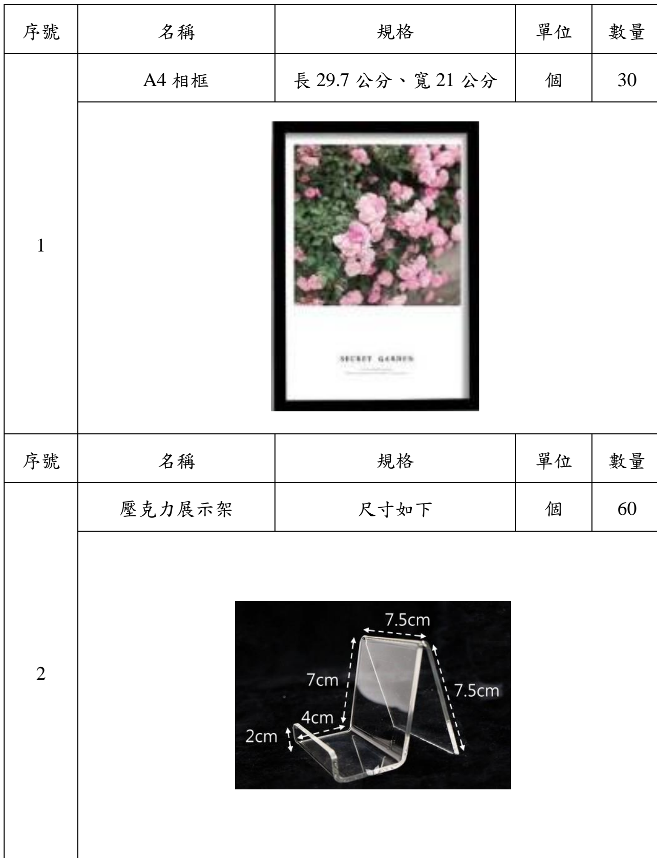
附表二 展覽物品一覽表